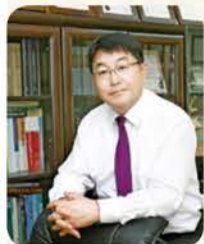
참지공파 제25세 이 호 중

가문의 뿌리를 궁금해 하던 아들이 벌써 고2가 되었다. 초등학교 5학년이던 아들이 콧수염이 제법 거뭇해진 청소년으로 성장해 대학입시에 매달리고 있는 것을 보니 새삼 세월이 빠름을 느끼게 된다. 기고를 한 지 여섯 해가 흘렀어도 아들의 조상에 대한 관심은 그대로 역사공부로 이어져, 대학전공도 역사관련 학과로 진학하려고 하니 여간 대견스럽지가 않다. 내심으로는 로스쿨을 목표로 하여 법조인의 삶을 이어가 주길 바랐지만 그 고집은 꺾일 것 같지가 않으니 한편으로는 서운하기도 하다.