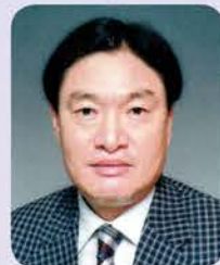
우소재공파 제25세 이영근

사천(泗川)이 본관(本貫)인 이정(李楨)선생은 호(號)가 구암(龜巖)이다. 선생은 1512년 사천현 구암동에서 태어났다. 어려서부터 할아버지로부터 가학(家學)을 전수받아 기초적인 학문과 경전을 배운 바탕 위에서 행실을 닦을 줄 알았으며, 마침 사림계의 유명인사인 구암 송인수가 바른 길을 주장하다가 조정에 용납되지 못하고 쫓겨나 사천에 귀향 와 있었으므로, 구암이 그에게 나아가 성리학을 배웠다. 학문을 완성하여 25세 때인 1536년(중종31년) 촉망부로서 문과별시에 장원급제, 3월에 처음 성균관 전적을 시작으로 관직에 나서게 되었다.